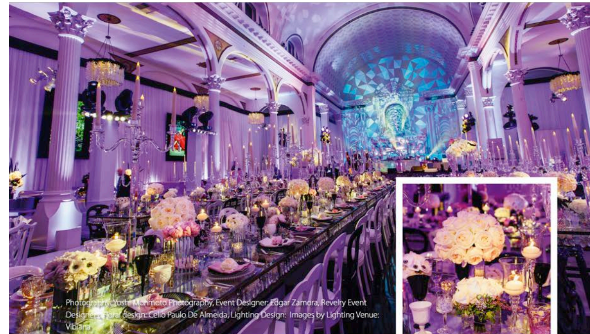
Event Designer: Edgar Zamora, Revelry Event Designers, Floral design: Cello Paulo De Almeida, Lighting Design: Images by Lighting Venue: Vibiana

Оксана: У тебя много VIP-клиентов. Как тебе удалось их заполучить?