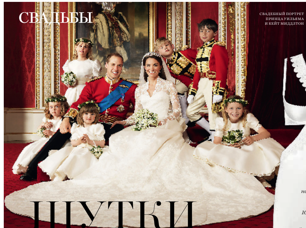
СВАДЕБНЫЙ ПОРТРЕТ ПРИНЦА УИЛЬЯМА И КЕЙТ МИДДЛТОН