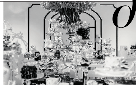
ДЕКОРАТОРСТВО REVELRY EVENT DESIGNERS