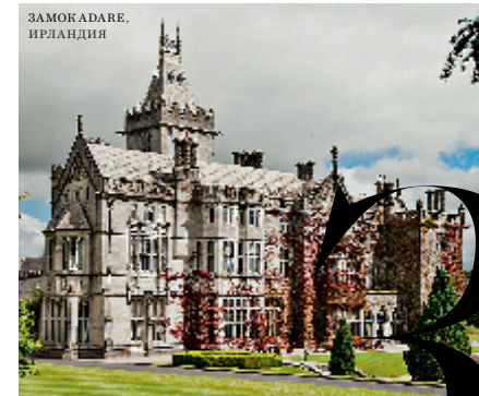
ЗАМОК ADARE, ИРЛАНДИЯ

Дабы не пришлось погулять ипподром для дареных коней, четко формулируйте свои желания. Или позанимуйтесь у тех, кому еще есть что желать. Вот нам, например, по душе хрусталь BACCARAT.