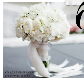
СВАДЕБНЫЙ БУКЕТ ОТ СТУДИИ MAU